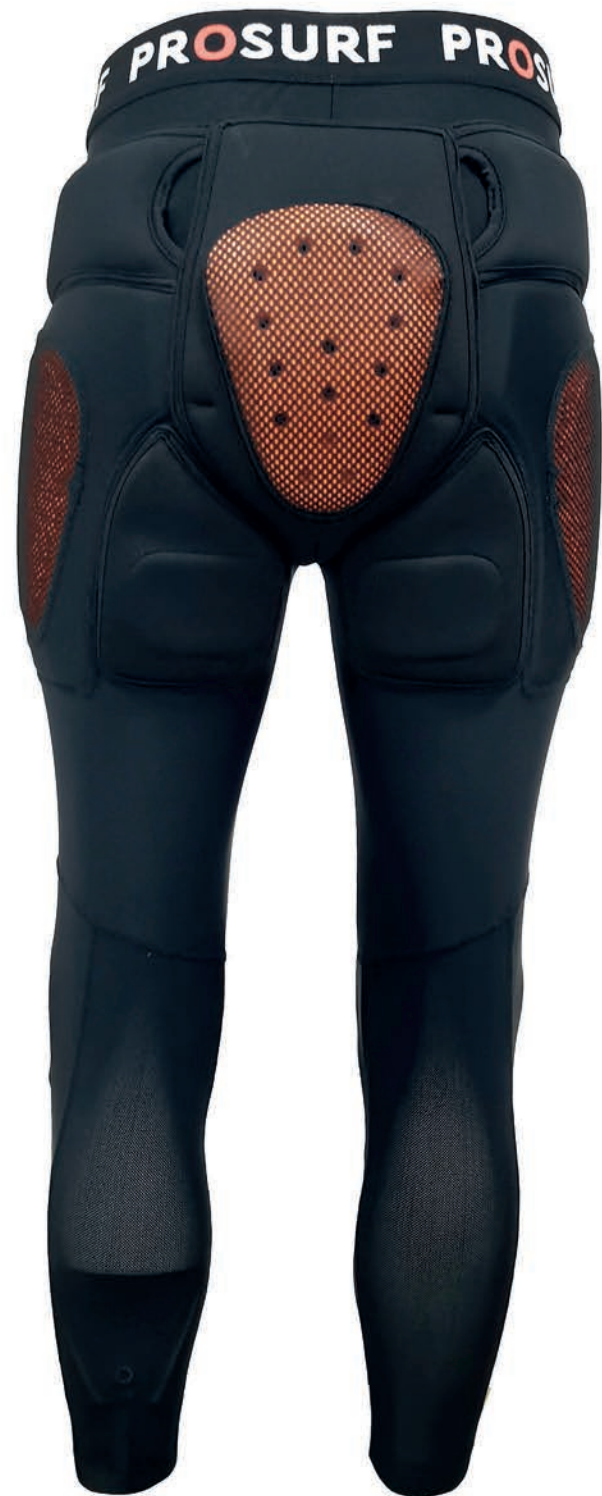
PS11 PANTALON D30 COMPLET S - M - L - XL FULL D30 PANTS