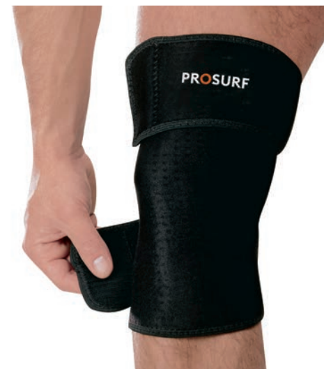
PS20 GENOILLÈRE FERMÉE TAILLE UNIQUE CLOSED KNEE SUPPORT