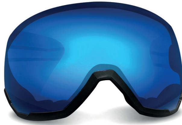
PHOTOCHROMIQUE BLUE LENS