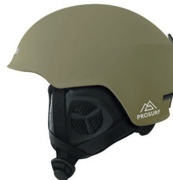
UNICOLOR KAKI STONE