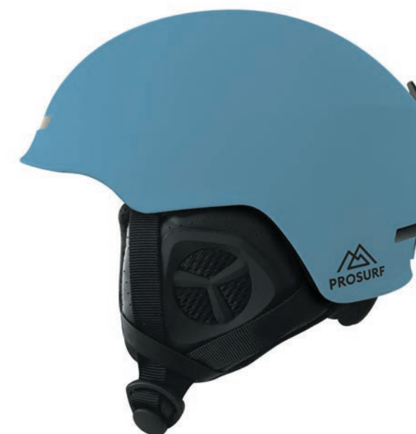
UNICOLOR BLUE STONE