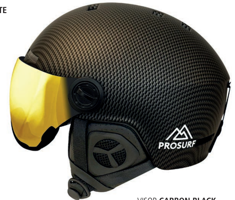
VISOR CARBON BLACK