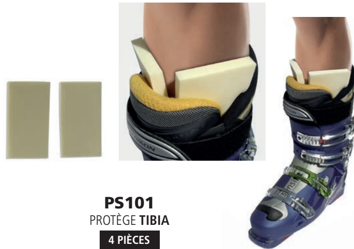
PS101 PROTÈGE TIBIA 4 PIÈCES