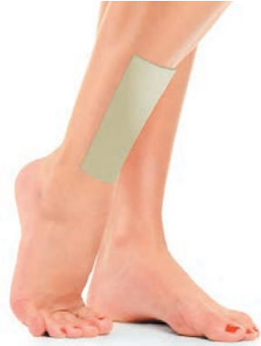
PS124 PROTECTION TIBIA 2 PIÈCES