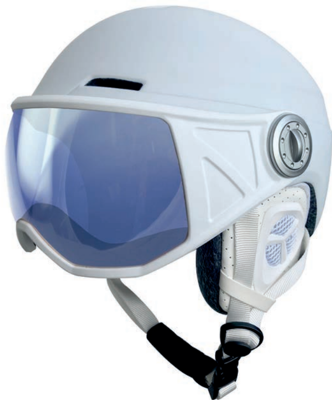
ICE VISOR WHITE