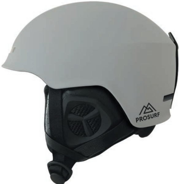
UNICOLOR GREY STONE