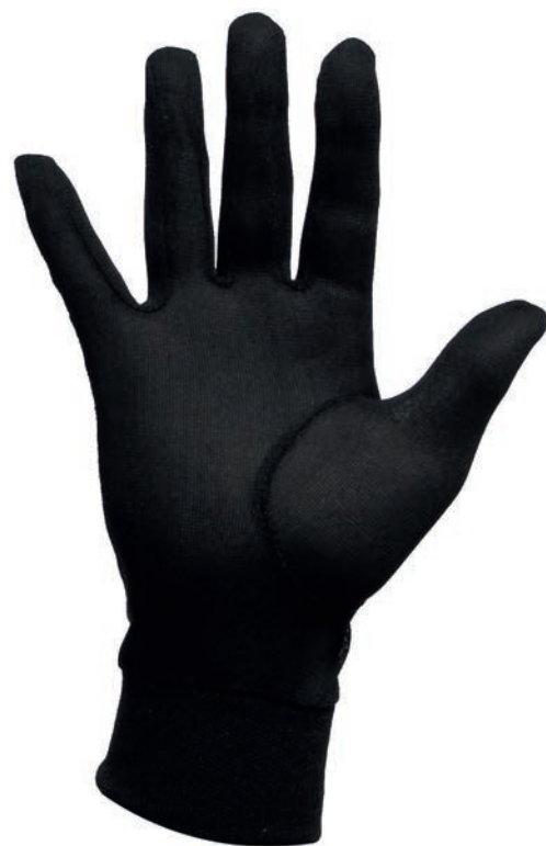
PS41 GANTS EN SOIE