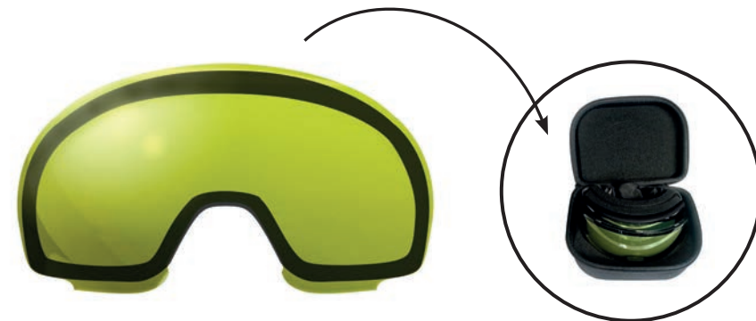
2 EME ECRAN + HOUSSE DE RANGEMENT