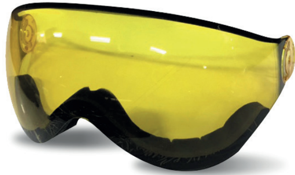
CATEGORY 1 LENS