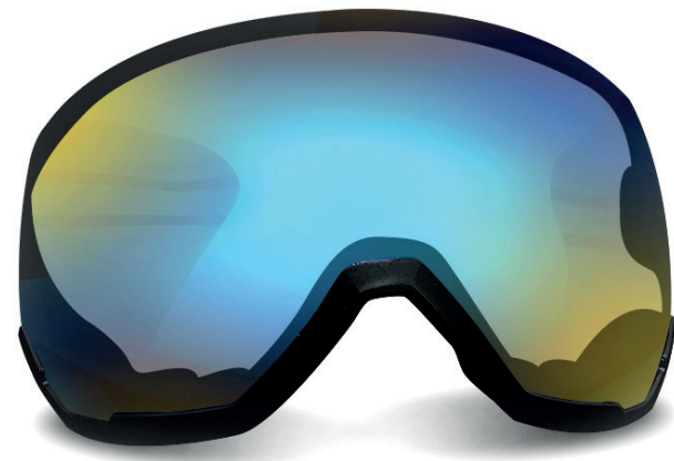
PHOTOCHROMIQUE GOLD LENS