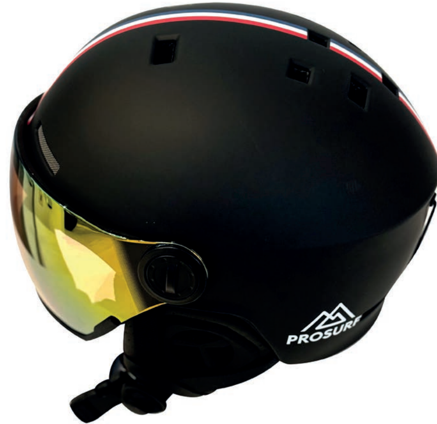
FRENCH RACING BLACK