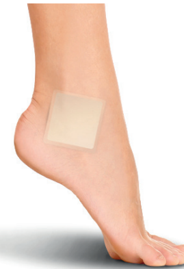
PS1012 PANSEMENTS MALLÉOLES 4 PIÈCES