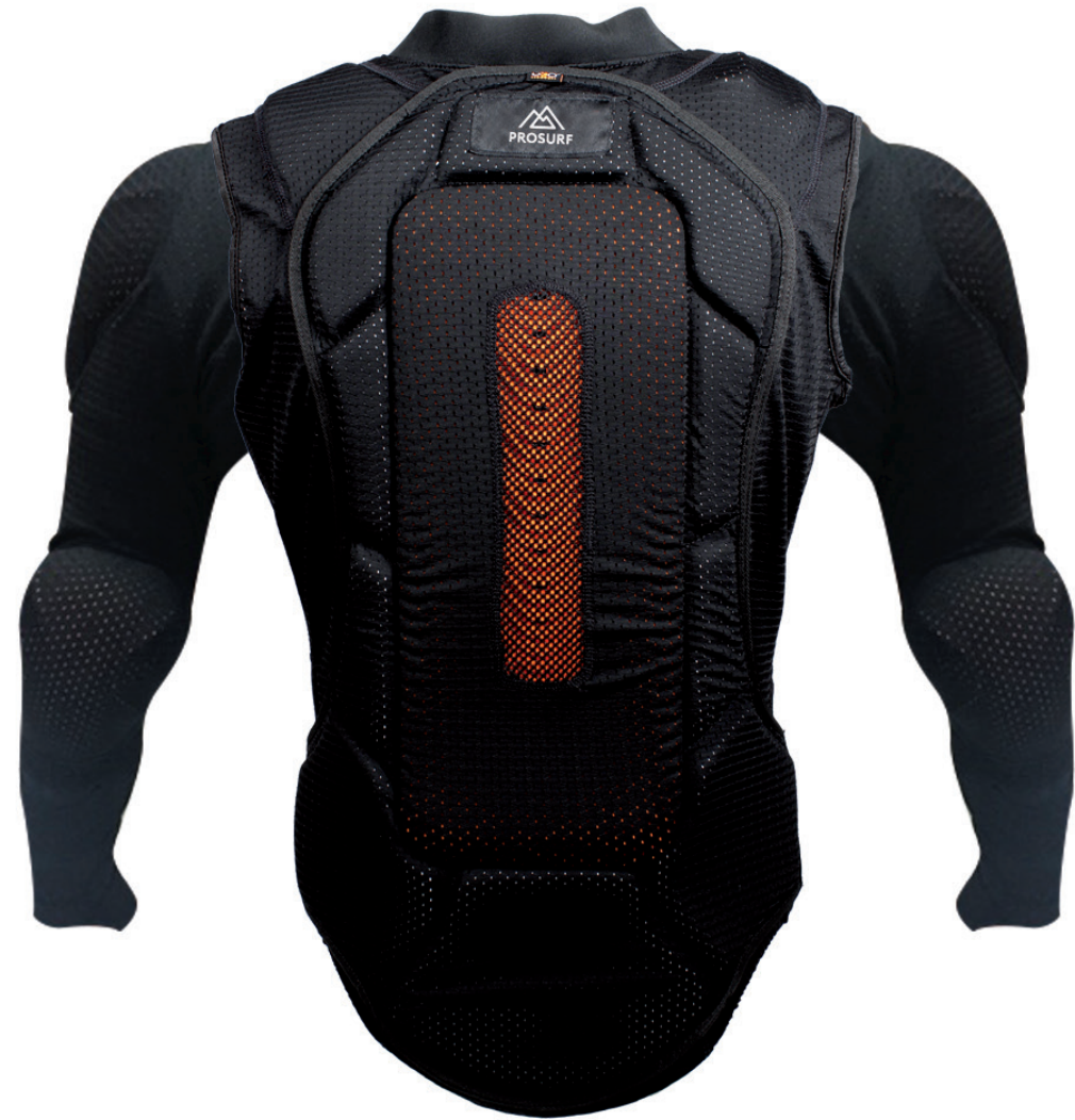
PS08 GILET DORSAL INTÉGRAL S - M - L - XL