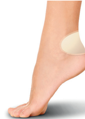
PS1001 PANSEMENTS AMPOULES TALONS 6 PIÈCES