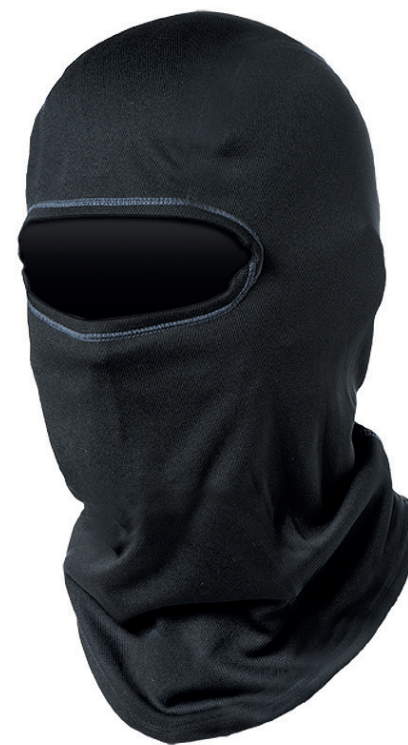
PROFILE CAGOULE EN SOIE