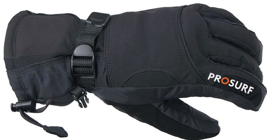
PS09 GANTS SKI