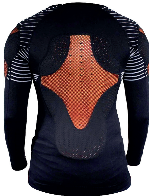
PS10 MAILLOT DE PROTECTION D30