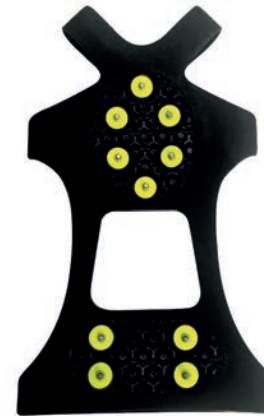
PS43 CRAMPONS ANTI-GLISSE S - M - L - XL ANTI SLIPPERY STUDS