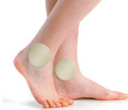
PS126 PROTECTION MALLÉOLE 4 PIÈCES