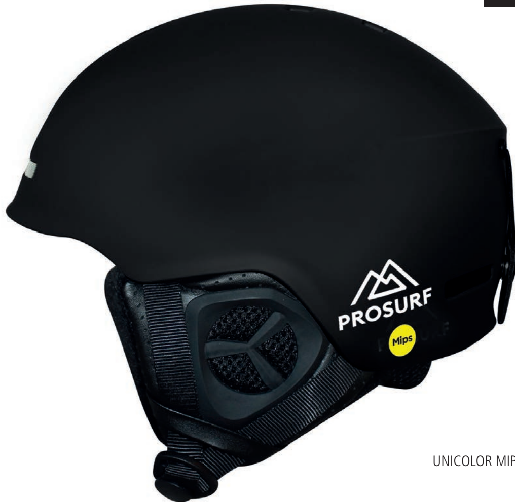
UNICOLOR MIPS BLACK

MIPS™ technology has very little influence on the weight of the helmet (30 grams) and its volume.