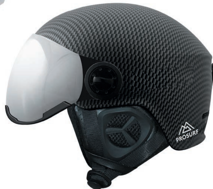
CARBON VISOR BLACK