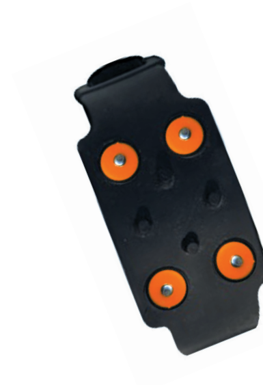
PS42 1/2 CRAMPONS ANTI-GLISSE TAILLE UNIQUE HALF ANTI SLIPPERY STUDS