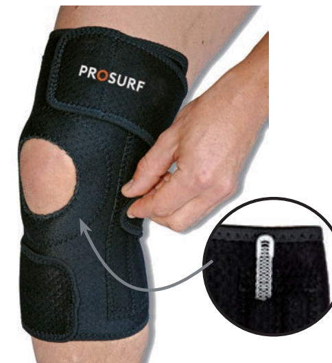
PS21 GENOILLÈRE RENFORCÉE TAILLE UNIQUE KNEE STABILIZER