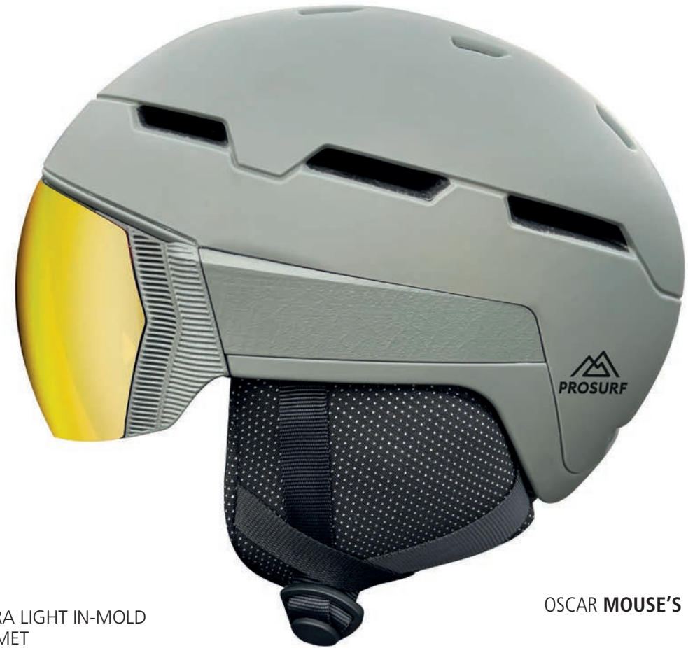
OSCAR MOUSE'S BACK