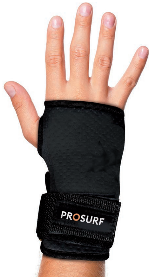
PS03 PROTECTION POIGNET XS - S - M - L - XL WRIST GUARD