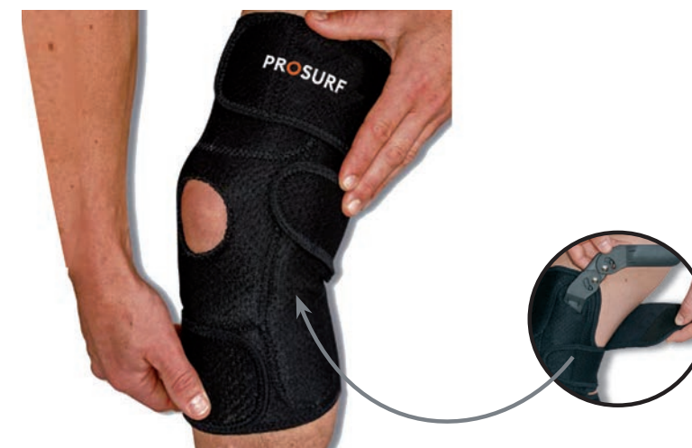
PS22 GENOILLÈRE ATTELLES TAILLE UNIQUE KNEE STABILIZER WITH SPLINTS