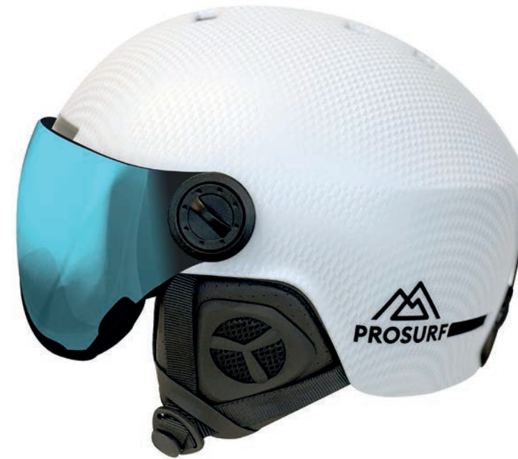
VISOR CARBON WHITE