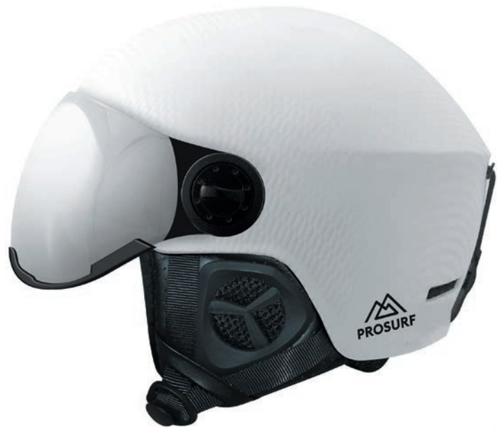
CARBON VISOR WHITE