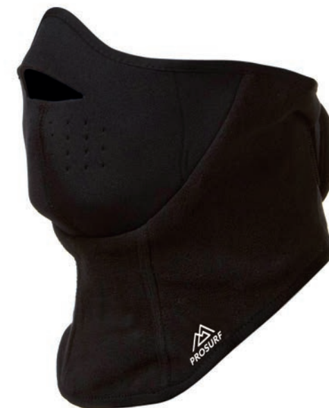
PS001 MASQUE NÉOPRÈNE