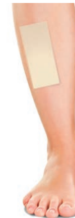
PS1013 PANSEMENTS TIBIAS 2 PIÈCES