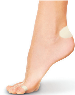
PS1003 PANSEMENTS AMPOULES MIXTES 3 + 3 PIÈCES