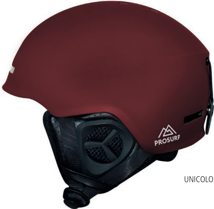
UNICOLOR GARNET RED