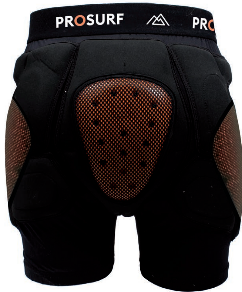
PS04 SHORT D30 COMPLET XS - S - M - L - XL FULL D30 SHORTS