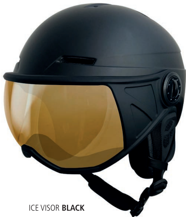
ICE VISOR BLACK