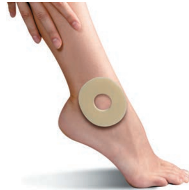
PS100 PROTÈGE MALLÉOLE 4 PIÈCES