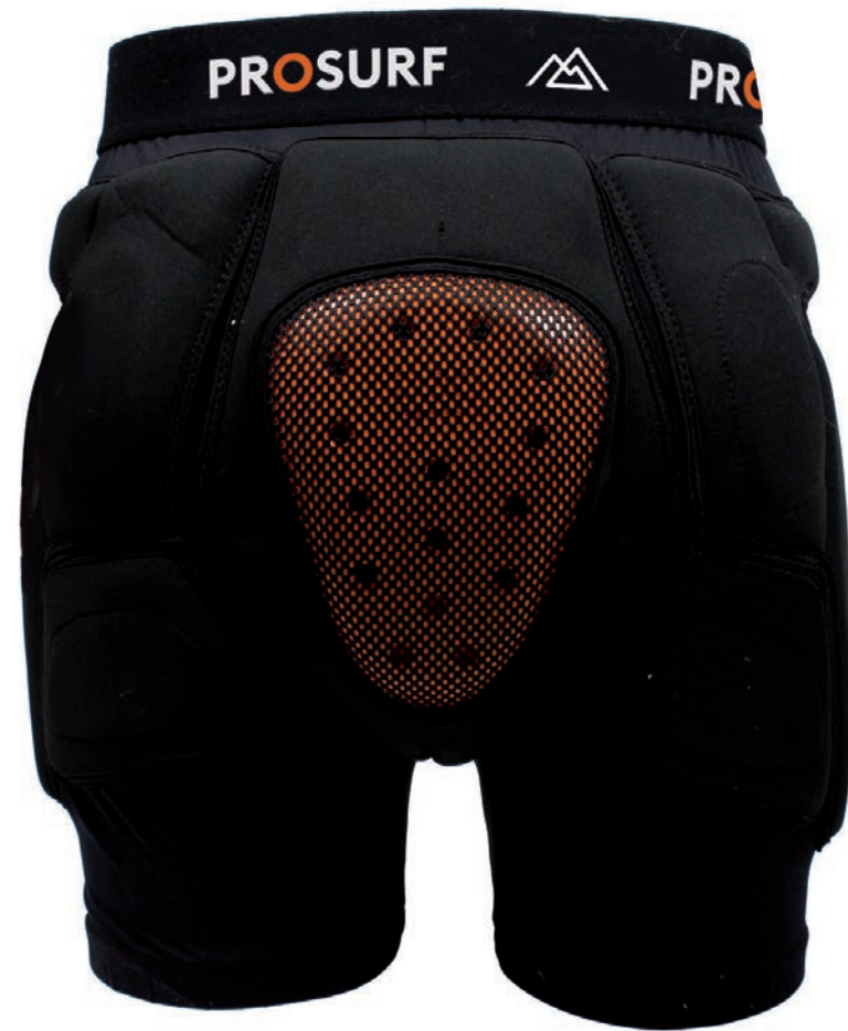
PS05 SHORT DE PROTECTION XXS - XS - S - M - L - XL PROTECTION SHORTS